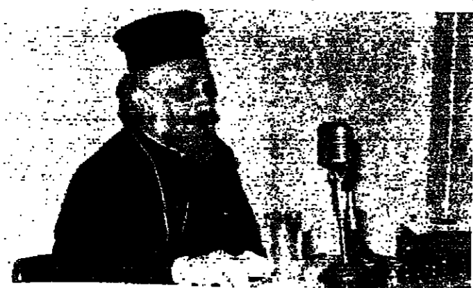
المطران خضر يلقى محاضرته في النادي الثقافي العربي مساء أمس

التي يصادفها عيد سيدة المطران جورج خضر في النادي الثقافي العربي، محاضرة حول «المسيحية الشرقية والمسيحية الغربية».